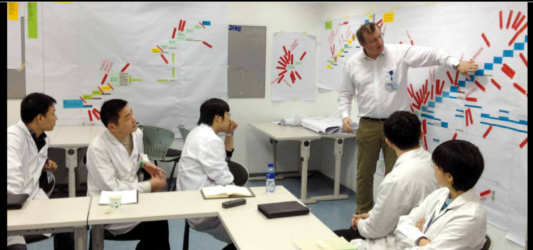
Das Ziel eines erfolgreichen Wissensmanagements ist unter anderem die punktgenaue Erkennung vom Schulungsbedarf der Mitarbeiter und die bestmögliche Nutzung der vorhandenen Ressourcen.