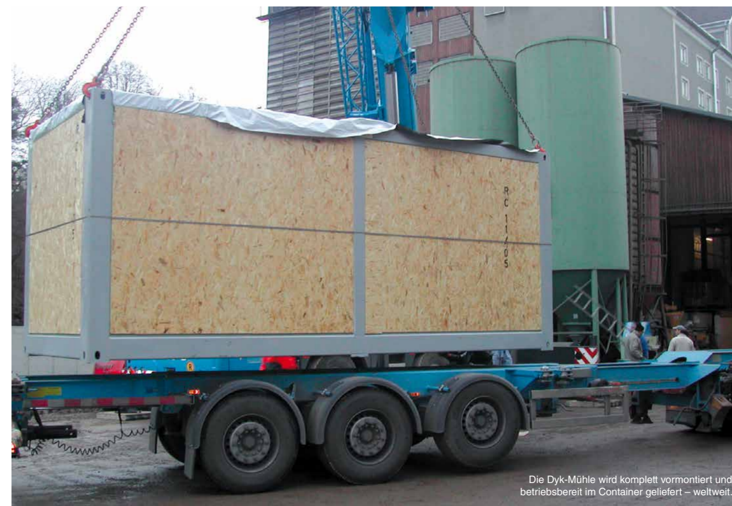
Die Dyk-Mühle wird komplett vormontiert und betriebsbereit im Container geliefert – weltweit.

Der ständige Wandel der Branche, jede Aufgabe braucht neue Ideen.