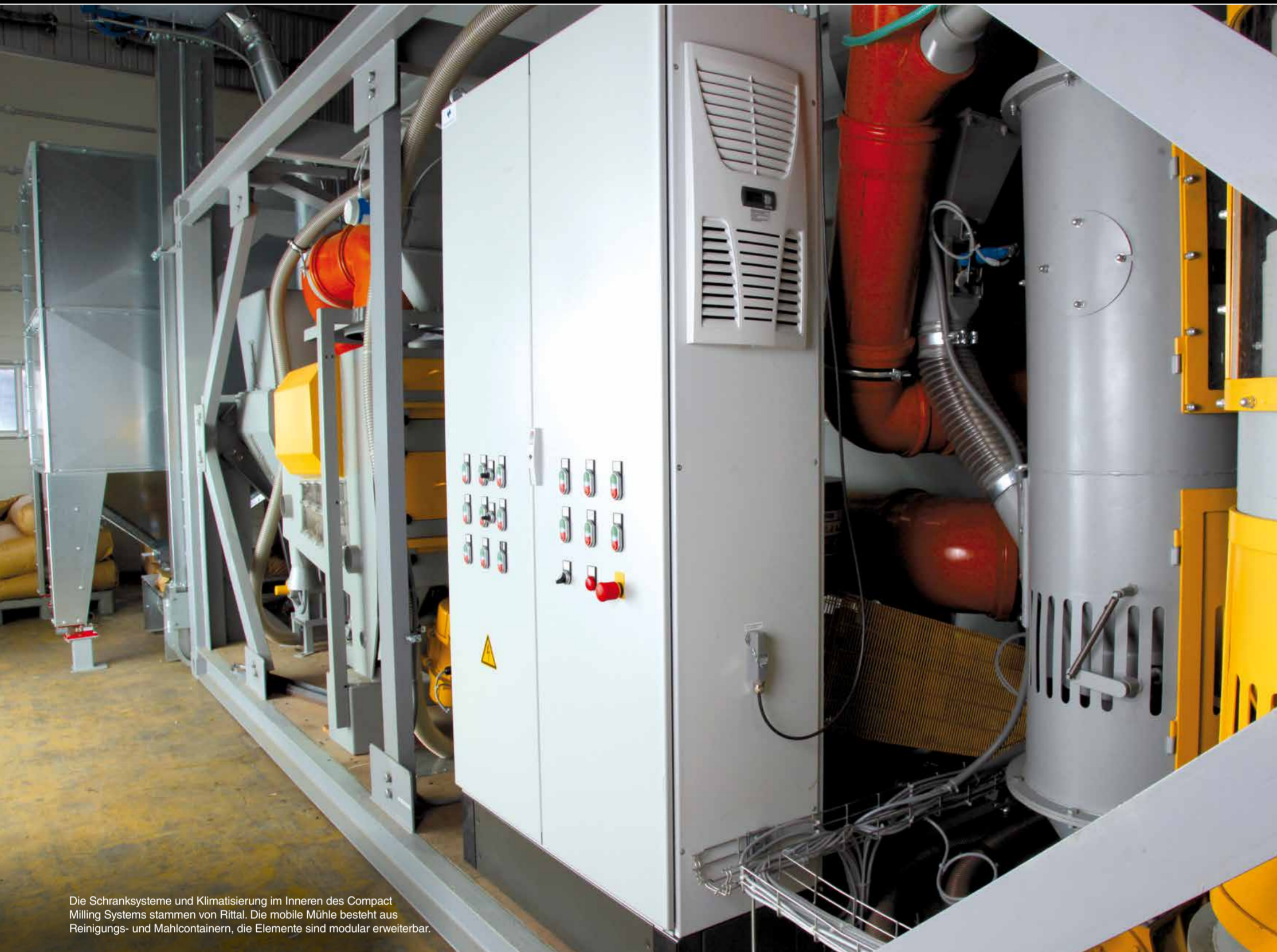
Die Schranksysteme und Klimatisierung im Inneren des Compact Milling Systems stammen von Rittal. Die mobile Mühle besteht aus Reinigungs- und Mahlcontainern, die Elemente sind modular erweiterbar.